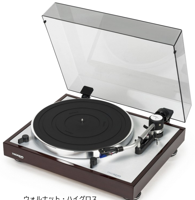
ウォルナット・ハイグロス